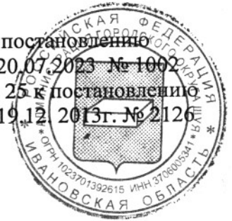
Схема № 25

Приложение к постановлению Администрации г.о. Шуя от 20.07.2023 № 1002 Приложение № 25 к постановлению Администрации г.о. Шуя от 19.12.2013г. № 2126