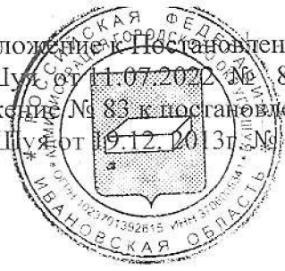
Схема № 83