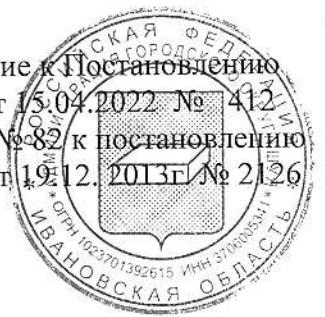
Схема № 82