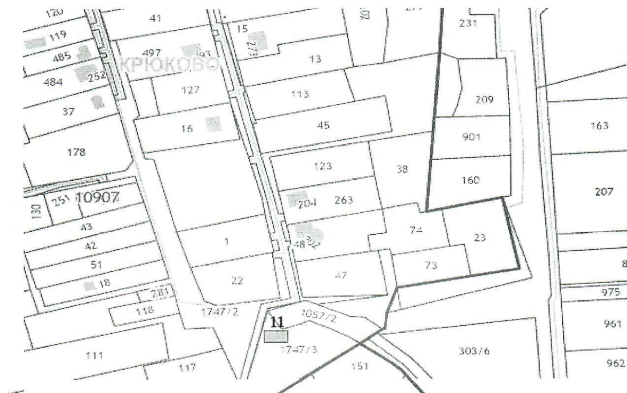
Схема № 12, места № 12, 13 (с. Семеновское)