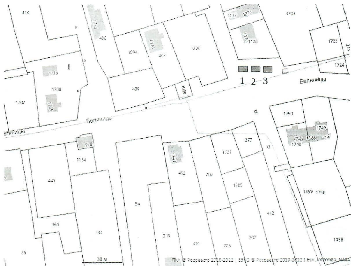
Схема № 2, место № 4 (д. Кривцово)