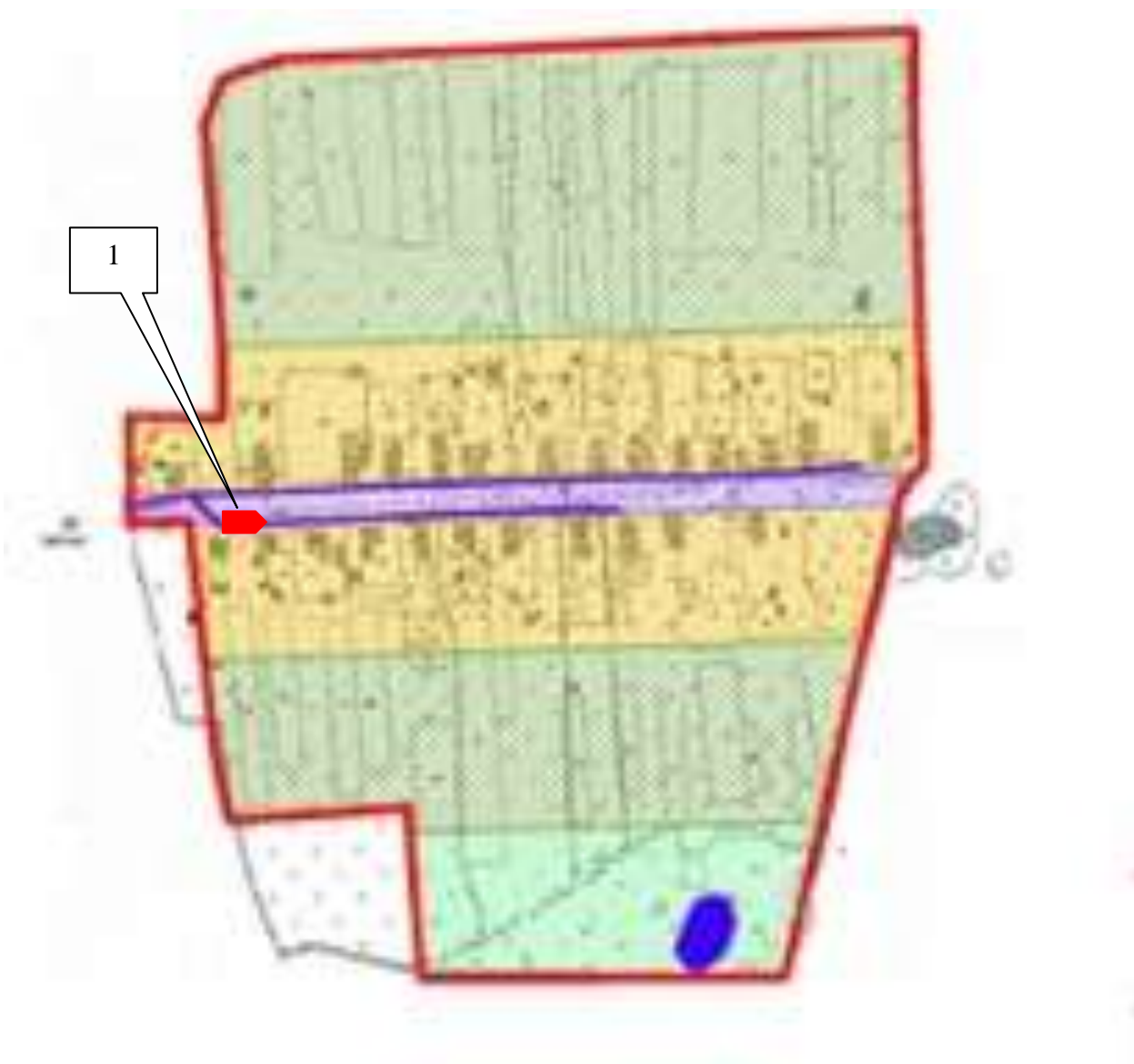
Схема размещения нестационарных торговых объектов на территории Перемиловского сельского поселения Шуйского муниципального района (д. Воронеж)