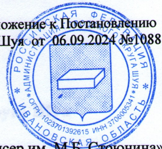
Схема № 79