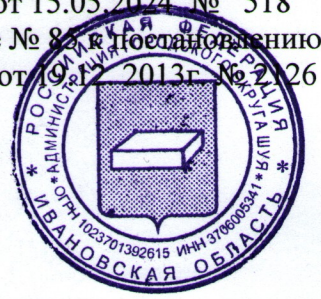
Схема № 85