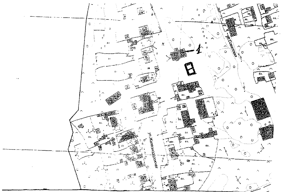
Схема расположения нестационарных торговых объектов на территории Мостовского сельского поселения